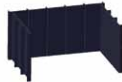
INTERIOR ACERO. Gran poder de transmisión de calor.