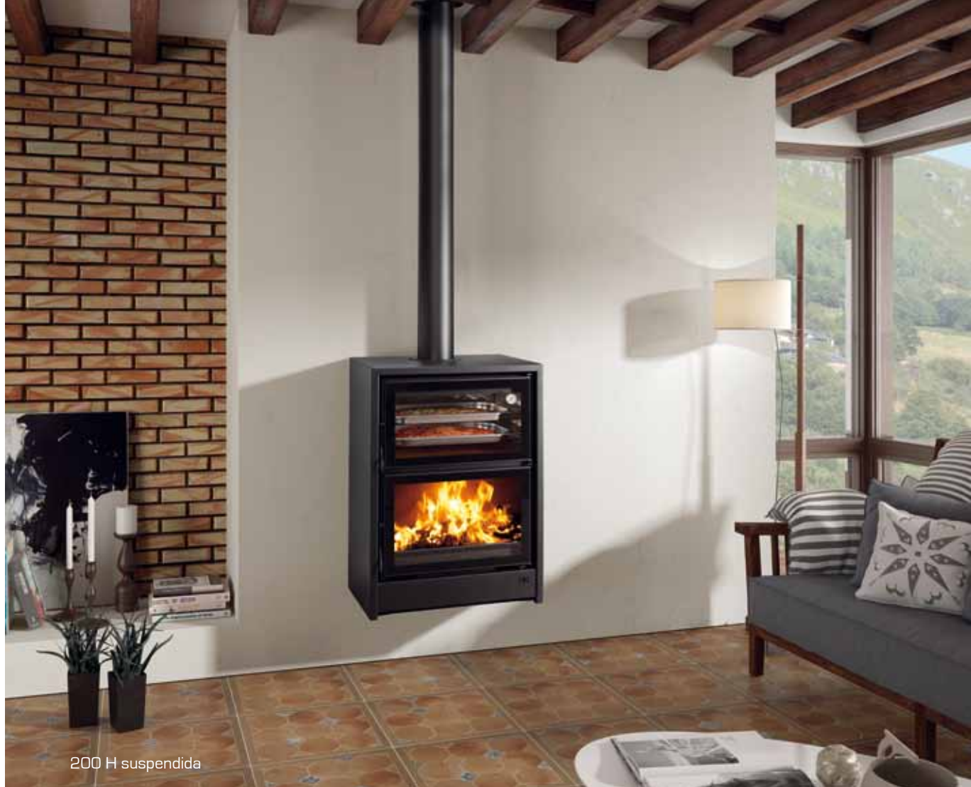
200 H suspendida