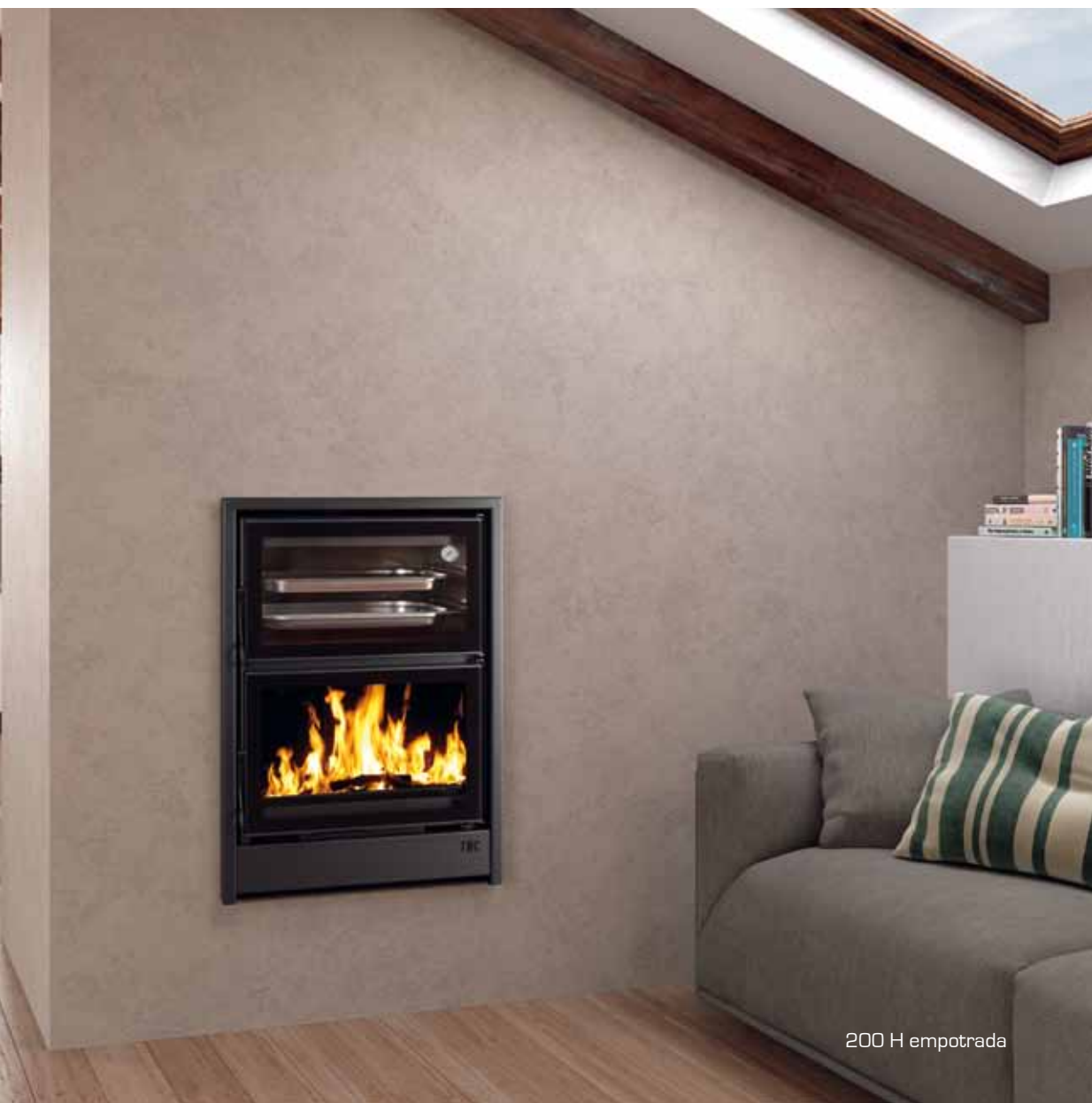
200 H empotrada