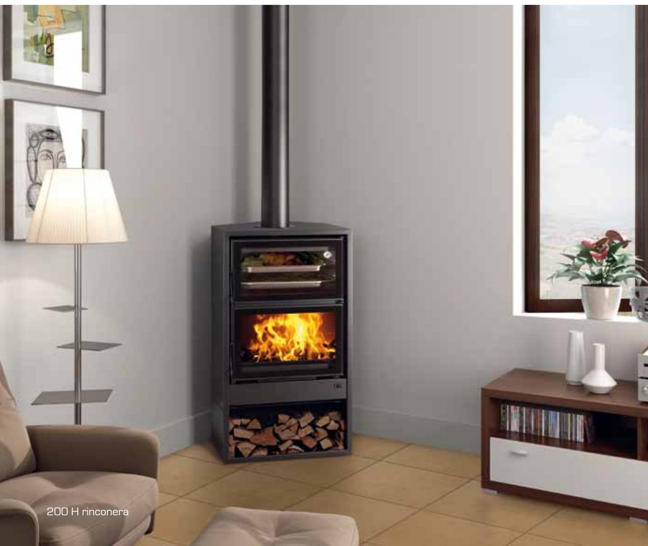
200 H rinconera