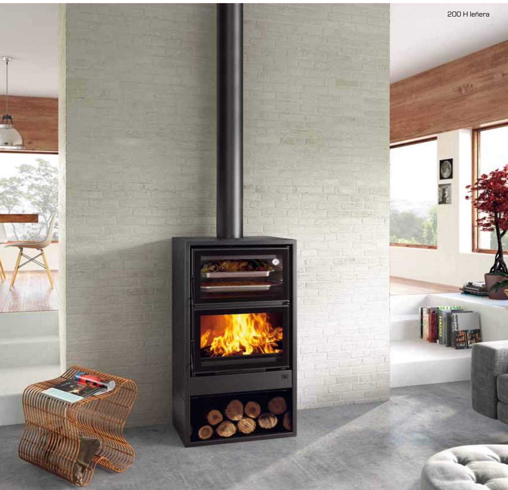
200 H leñera

Recupere el gusto por lo auténtico y deguste tanto a la brasa, como horneados o cocidos con sabor tradicional.