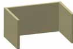
INTERIOR VERMICULITA 750 kg/m 3 . Gran poder de refracción.