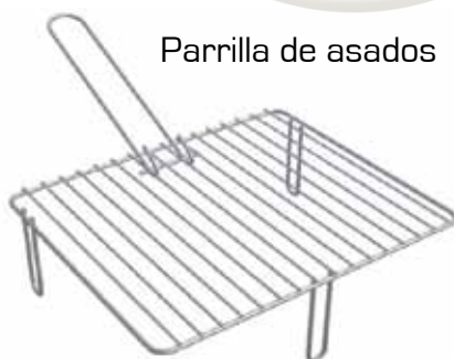
Parrilla de asados