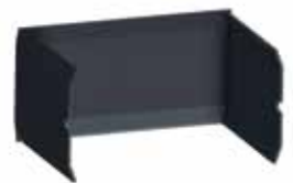
INTERIOR ACERO REFORZADO. Gran poder de transmisión que se mantiene por más tiempo.