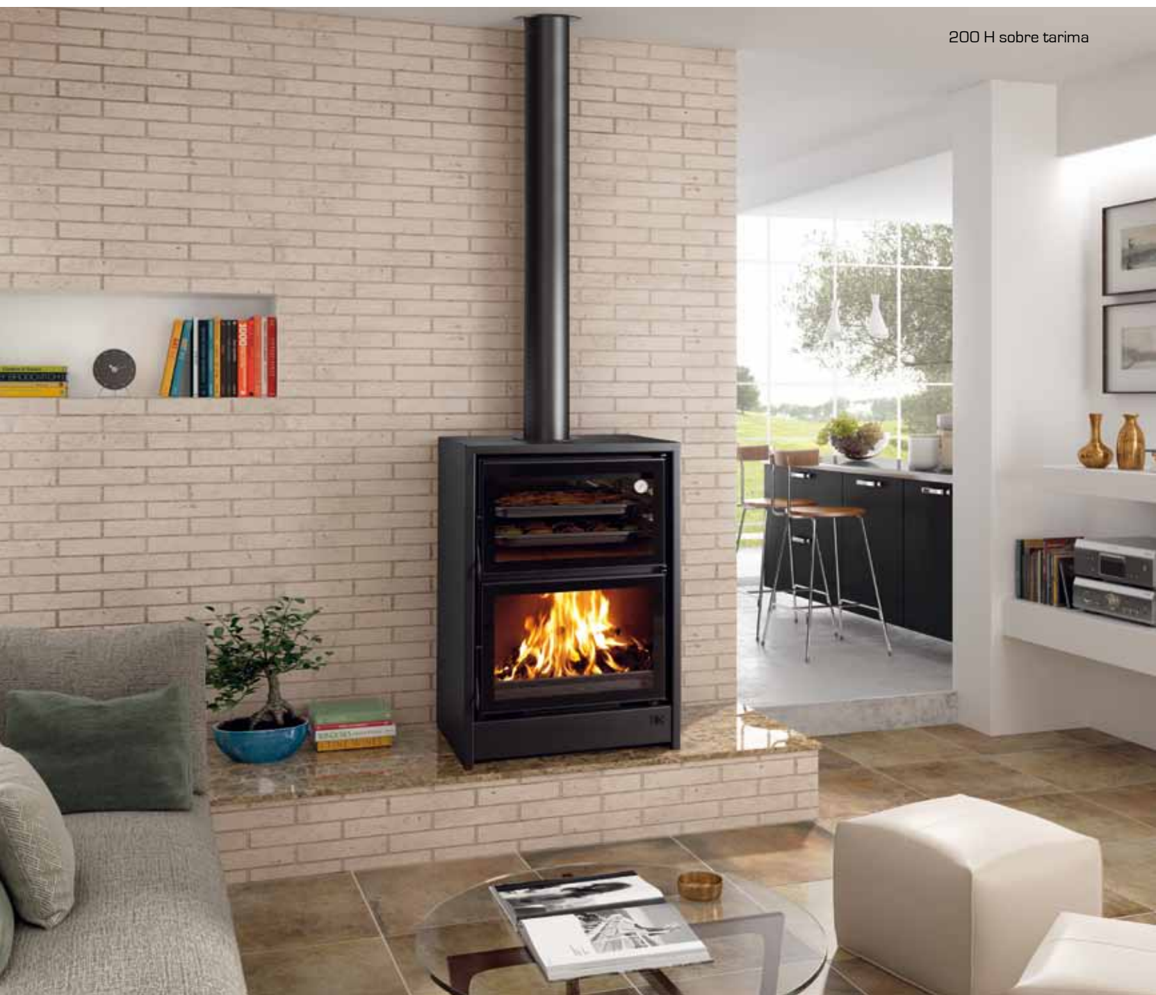
200 H sobre tarima

Todas las piezas por separado y en su conjunto han sido homologadas. Nuestro gabinete técnico las ha sometido a las pruebas más duras en condiciones límite, dando como resultado un aparato de gama alta tanto en calidad como en rendimiento. Todo ello en un conjunto de materiales nobles que forman un compendio de la más avanzada tecnología.